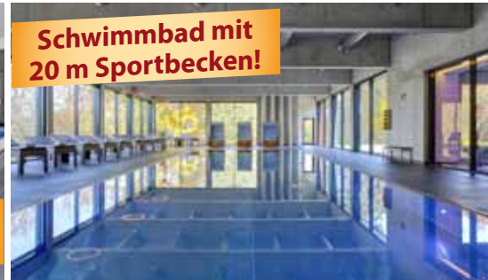
Schwimmbad mit 20 m Sportbecken!

Das 4-Sterne-Parkhotel CUP VITALIS begeistert seine Gäste mit seinem einladenden Ambiente, der traumhaften Aussicht auf Bad Kissingen und die umliegenden Wälder, seinem großen SPA & Sportbereich sowie der 35.000 m 2 großen Parkanlage, die es umgibt.