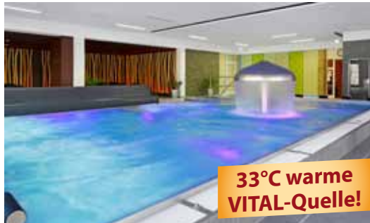
33°C warme VITAL-Quelle!