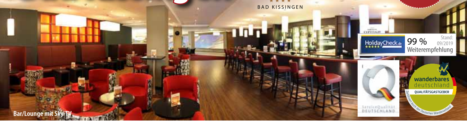
Bar/Lounge mit Sky-TV

HolidayCheck 99% Stand: 09/2019 Weiterempfehlung