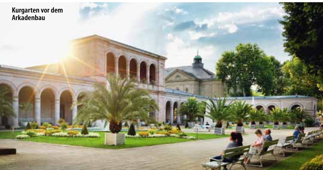
Kurgarten vor dem Arkadenbau